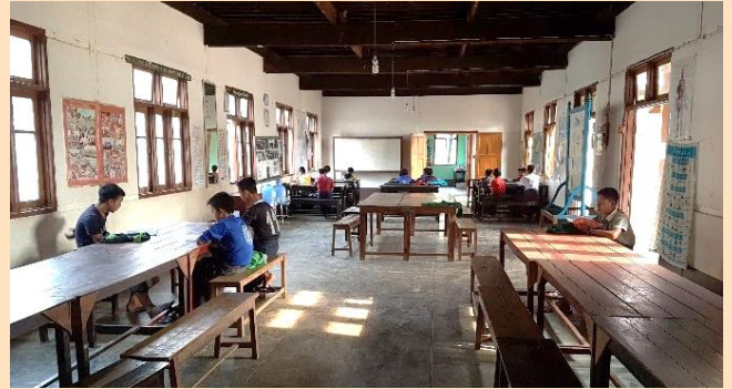
De studieruimte in het jongenshuis

Ook de jongens helpen mee in de groentetuin. Hun taken zijn spitten, onkruid wieden en planten water geven.