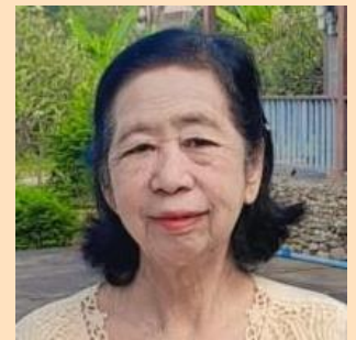
Daw Mya Sein Kokkin voor beide huizen