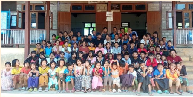
Alle kinderen samen op de trap voor het jongenshuis.

In onze weeshuizen wonen in totaal 60 wezen, half-wezen en kinderen uit zeer arme gezinnen.